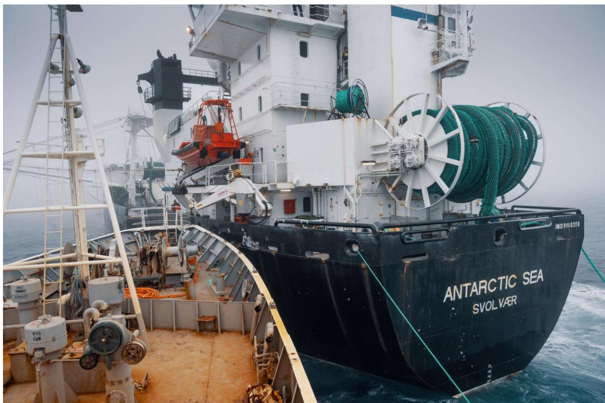
Captain Paul Watson Bandero and Aker Antarctic Sea Collide

Während in Deutschland die Strandung eines Wals in der Ostsee viele Menschen bewegt und die Verletzlichkeit mariner Ökosysteme sichtbar macht, läuft am anderen Ende der Welt ein weitgehend unbeachteter Kampf zum Schutz der größten Meerestiere.